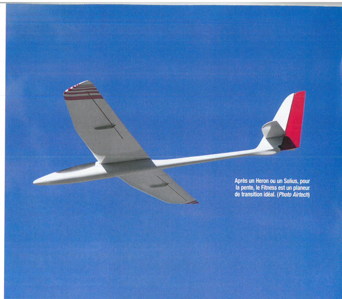
Après un Heron ou un Solius, pour la pente, le Fitness est un planeur de transition idéal.

Le véritable but des volets, c'est d'adapter le profil aux conditions du moment et/ou à ce que l'on souhaite comme type de vol. Mais