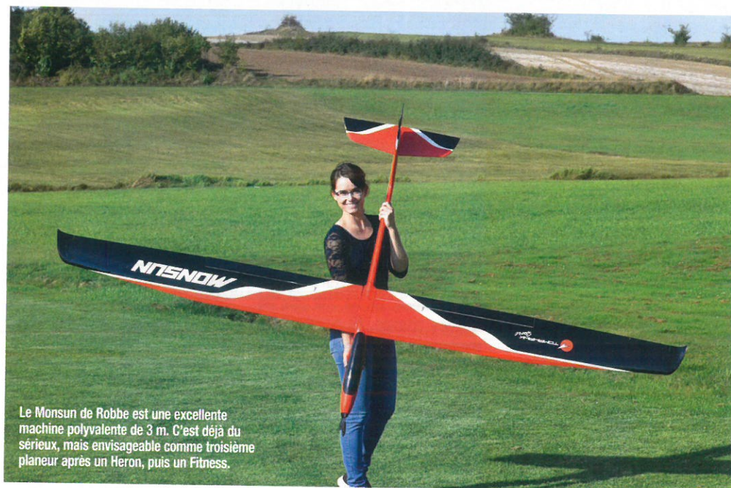
Le Monsun de Robbe est une excellente machine polyvalente de 3 m. C'est déjà du sérieux, mais envisageable comme troisième planeur après un Heron, puis un Fitness.