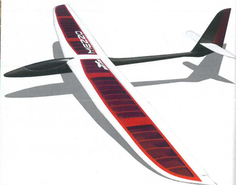
Après un Heron, un Mezzo est tout à fait envisageable pour la plaine, c'est une très belle machine.

En termes de pilotage, le Heron n'est pas si éloigné du Finesse Max. Ce dernier serait même plus facile, si ce n'était le prix de la casse.