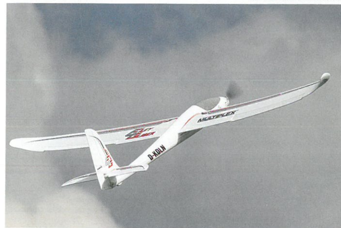
La version 4 est vraiment très aboutie, surtout avec son stabilisateur démontable.